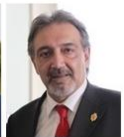
Francesco Rocca président de la Fédération internationale