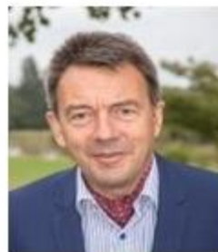
Peter Maurer président du CICR