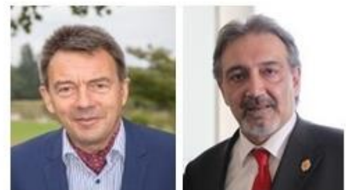
Peter Maurer Presidente CICR