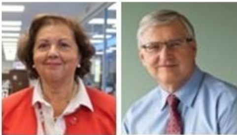
Mercedes Babé Presidenta