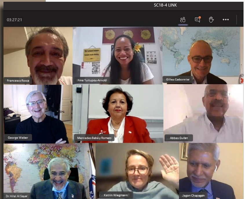
Cuarta reunión (virtual) de la Comisión Permanente, 8-9 de diciembre de 2020